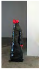
La bête à 5 têtes Sculpture